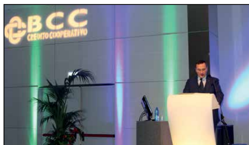
Il Presidente avv. Alessandro Azzi.

Per poter assicurare massima apertura e trasparenza ai propri Soci, BCC del Garda quest'anno sarà inoltre a disposizione per rispondere a tutti i dubbi e le domande circa le questioni assembleari: a partire dal 12 maggio tutti i Soci potranno contattare gli esperti della Banca all'indirizzo uff.comunicazione@garda.bcc.it o al numero verde 800292288.