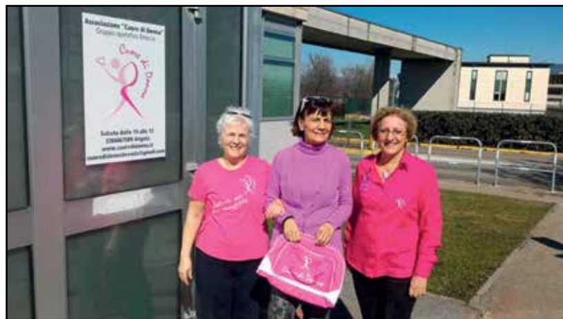
Alcune delle responsabili dell'Associazione Cuore di Donna.

Ma Cuore di donna è anche molto altro: aiuto concreto nel disbrigo di pratiche burocratiche e mediche, promozione di stili di vita per la riabilitazione psicologica attraverso attività sportive; eventi per promuovere la prevenzione, campagne di sensibilizzazione, convegni, serate a tema; stand a mercatini organizzati da comuni