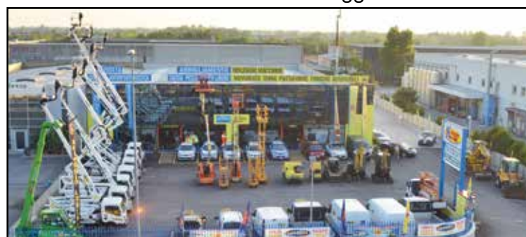
La nuova sede della Noleggio Lorini in zona industriale, via E. Montale 15.

SEDE: MONTICHIARI (BS) - Via E. Montale, 15 FILIALI: CALCINATO - CASTEGNATO tel. 030.9650556 - www.noleggiolorini.com